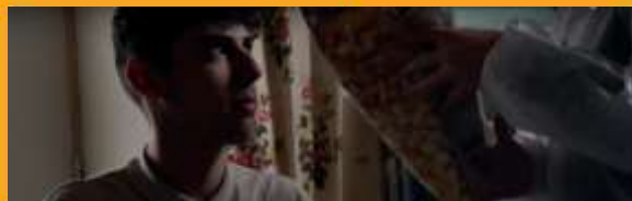
2ème Prix 2022 / Parce que je n'ai plus peur / Lycée Victor Duruy BAGNÈRES